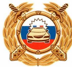
Госавтоинспекция МВД России

Буклет изготовлен по заказу Минпросвещения России в рамках реализации федеральной целевой программы «Повышение безопасности дорожного движения в 2013–2020 годах».