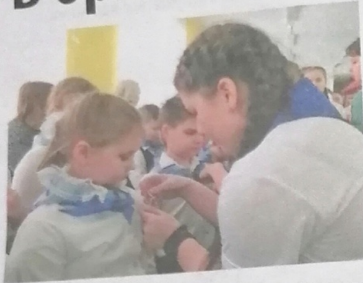
1 февраля для 87 учеников начальных классов Пижемской школы, участников Всероссийского проекта «Орлята России», прошла торжественная церемония посвящения в «орлята».

«Орлята России» — это яркие и интересные занятия по семи направлениям деятельности, это огромная команда талантливых и добрых ребят со всей нашей необъятной родины, которые живут под девизом «Учимся, растём, мечтаем вместе».