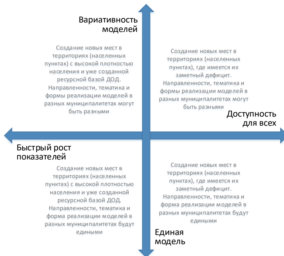
Рис. 4. Шкалы выбора модели создания новых мест с учетом актуальной управленческой политики