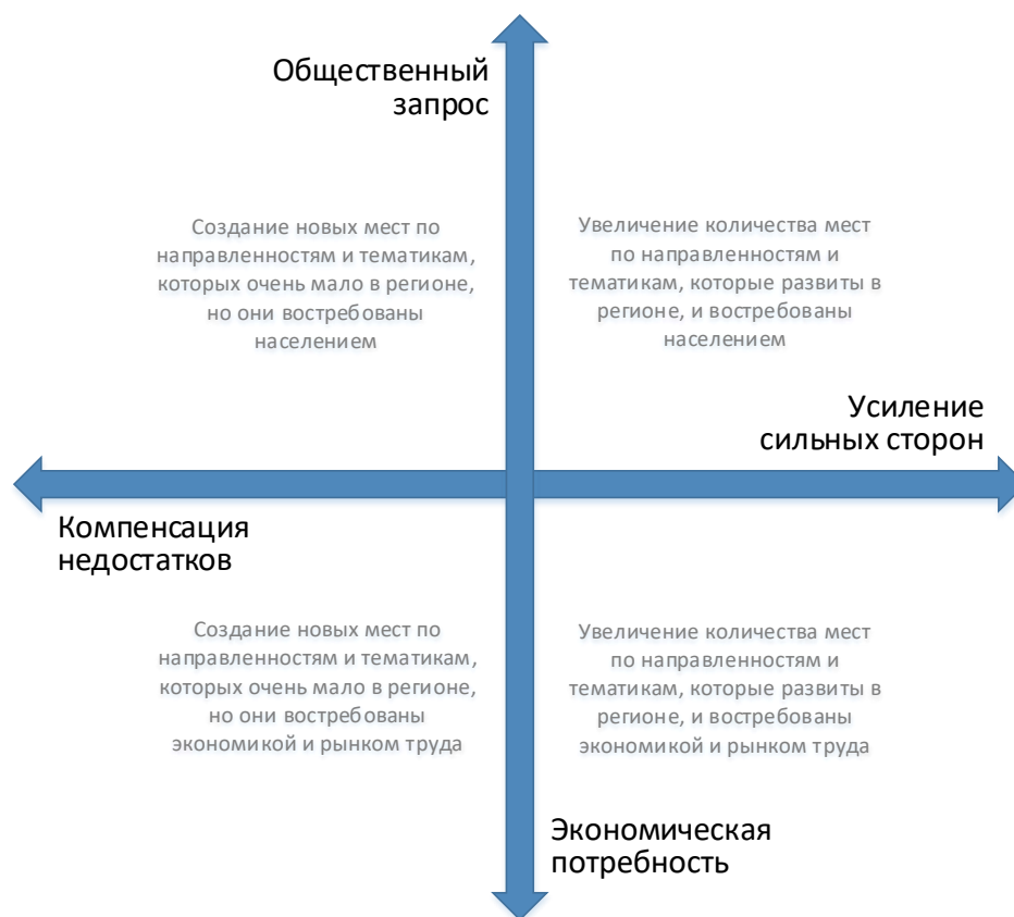
Рис. 2. Шкалы выбора тематики и тактики создания новых мест дополнительного образования