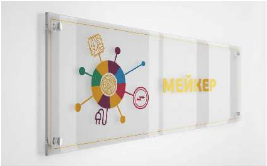
Примеры зонирования и визуализации современных пространств