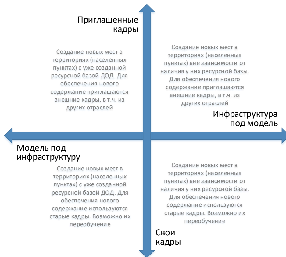
Рис. 6. Шкалы выбора модели инфраструктурного и кадрового обеспечения для типовой модели создания новых мест дополнительного образования

Следует отметить, что механизмы инфраструктурного и кадрового обеспечения не существуют в полярных вариантах. Решения даже в рамках реализации одной модели будут различны. Анализ перечисленных выше характеристик позволяет сделать эти точечные решения более точными и эффективными.