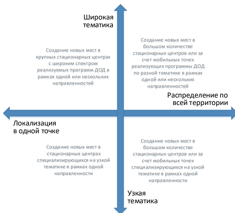
Рис. 3. Шкалы выбора масштаба и формы реализации новых мест по программам ДОД

При невыполнении хотя бы одного из них возникает необходимость пространственного распределения реализуемой модели через мобильные или сетевые решения.