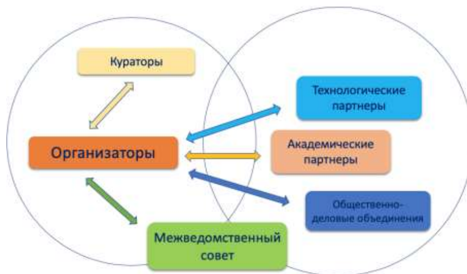
Рис. 1. Схема взаимодействия участников мероприятий по внедрению и функционированию типовой модели «Мейкер»