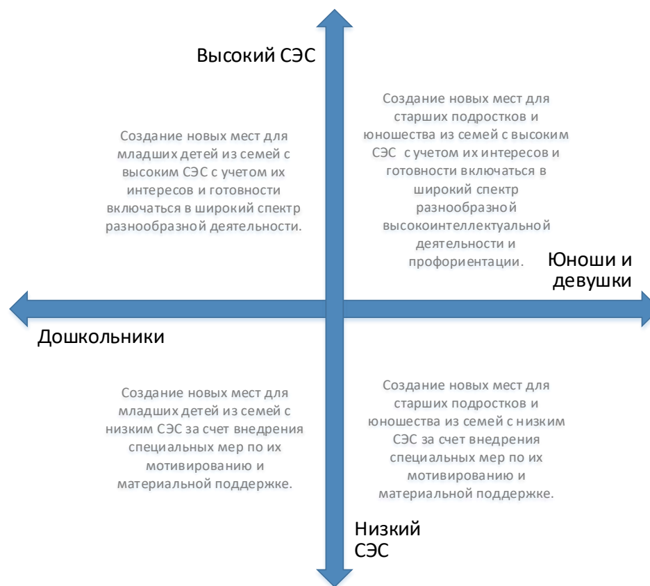
Рис. 5. Шкалы выбора модели создания новых мест по программам технической направленности с учетом особенностей контингента обучающихся

Вовлечение в программы детей из семей с низким образовательным и культурным уровнем потребует осуществления определенных PR-шагов, поиска мотиваторов для данных детей, в том числе материальных.